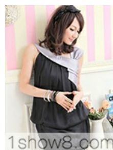
1show8.com B-1290 éHâ'sºpCÙ :÷260C 260 C 6ĭ | -p